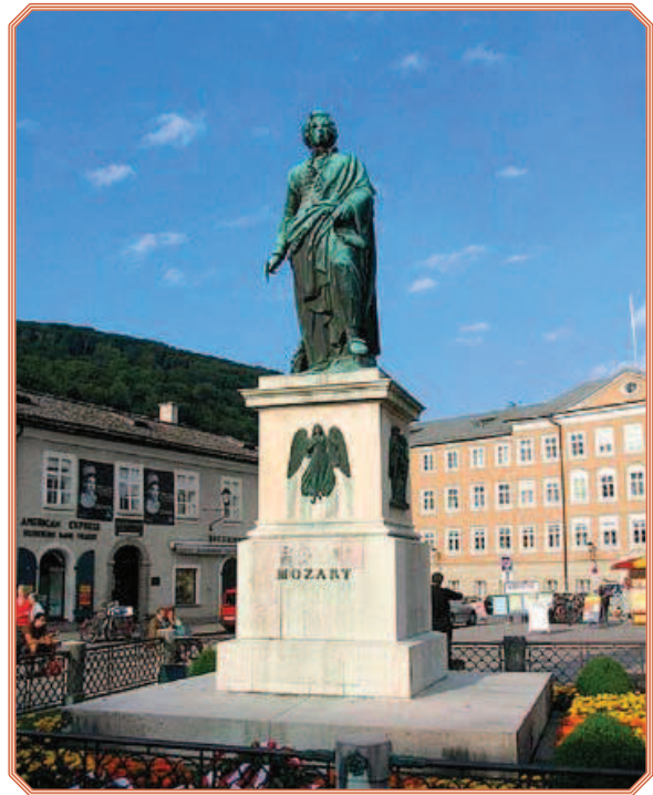
Rys. 8. Pomnik Mozarta w Salzburgu

Długą tradycję posiadają Mozartkugel (slajd 64) – czekoladki (dosł. „kulki Mozarta”), początkowo nazywane Mozartbombon (cukierki Mozarta), stworzone przez cukiernika Paula Fürsta. Produkowane i podawane są one od roku 1890 w kawiarni/cukierni Fürst w Salzburgu (slajd 65).