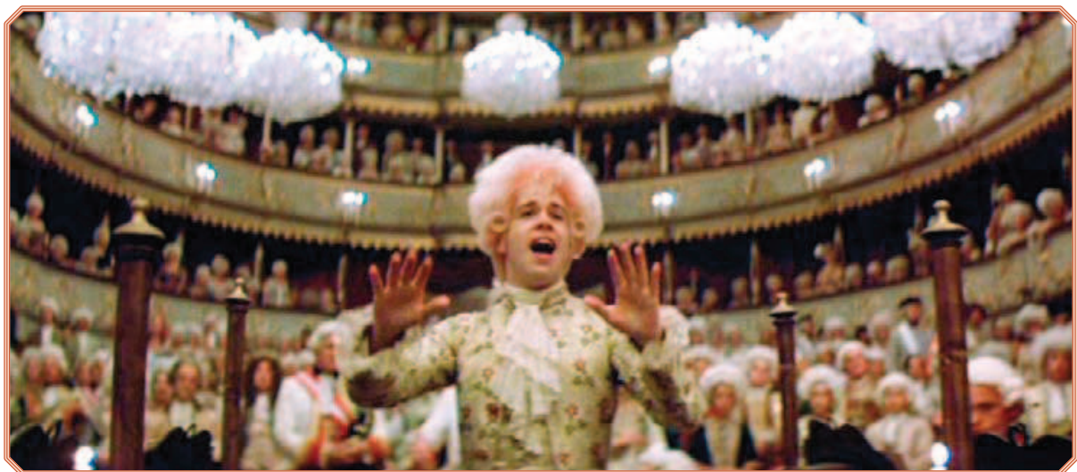
Rys. 11. Kadr z filmu Amadeusz