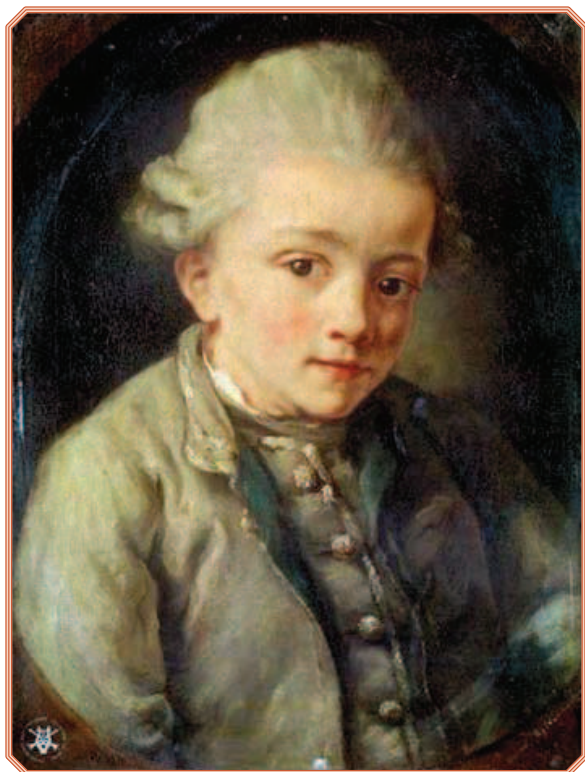
Rys. 6. Mozart jako chłopiec, obraz Jeana Baptiste'a Greuze'a z 1763–1764 roku

nych przez turystów miejscowości w Austrii. Przez wiele wieków swojej historii pełnił rolę ważnego ośrodka handlowego i komunikacyjnego. Nad miastem liczącym 150 tys. mieszkańców góruje twierdza Hohensalzburg, której początki sięgają XI wieku. Jest to największa zachowana w całości twierdza w Europie Środkowej, będącą symbolem Salzburga. Z Hohensalzburga rozciąga się widok na całe miasto.