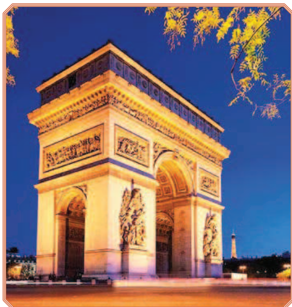
Rys. 4. Łuk Triumfalny w Paryżu

na sztucznej wyspie otoczonej jeziorem. Jest połączony z lądem dwoma mostami zwieńczonymi klasycystycznymi kolumnami.