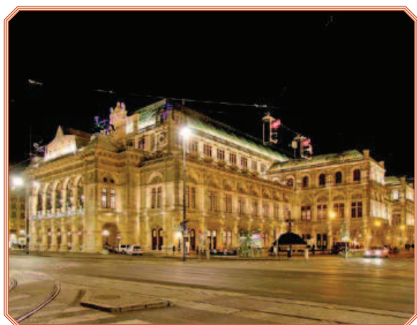
Rys. 9. Wiener Staatsoper nocą

Na tle slajdu 73 (przedstawienie Wesele Figara w Wiener Staatsoper z roku 2011) prezentujemy uczniom arię Figara z opery Wesele Figara (czas: ok. 4 minuty).