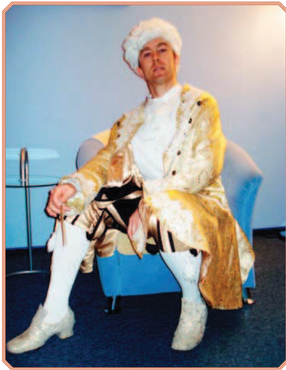
Rys. 1. Autor scenariusza przebrany za Mozarta