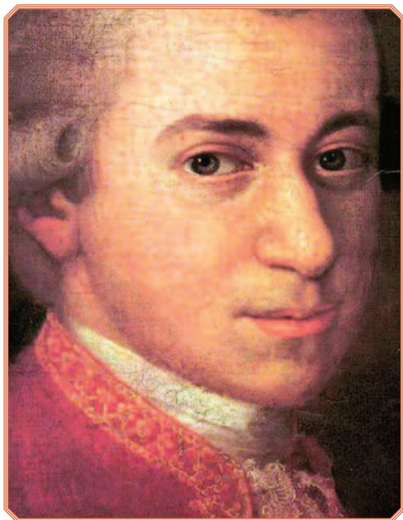
Rys. 3. Portret Mozarta z około 1780 roku, namalowany przez Johanna Nepomuka della Crocego, obraz ze zbiorów Uniwersytetu Mozarteum w Salzburgu

Oto trzech klasycy wiedeńscy. Dziś poznamy sylwetkę jednego z nich.