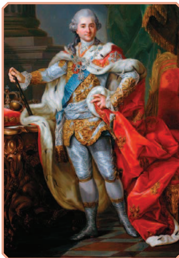
Rys. 5. Portret Stanisława Augusta Poniatowskiego w stroju koronacyjnym, obraz Marcella Bacciarellego ze zbiorów Zamku Królewskiego w Warszawie

Niemieckiego. Cesarze, podobnie jak królowie, w chwilach uroczystych na głowy zakładali korony (slajd 31, korona cesarska).